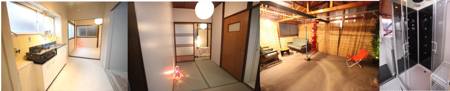
2-4キッチンからリビングを望む