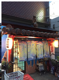
沖縄風情いっぱいの南恩加島地区 いい雰囲気銭湯が直ぐ