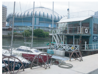
大正にはお洒落なバーがいっぱい