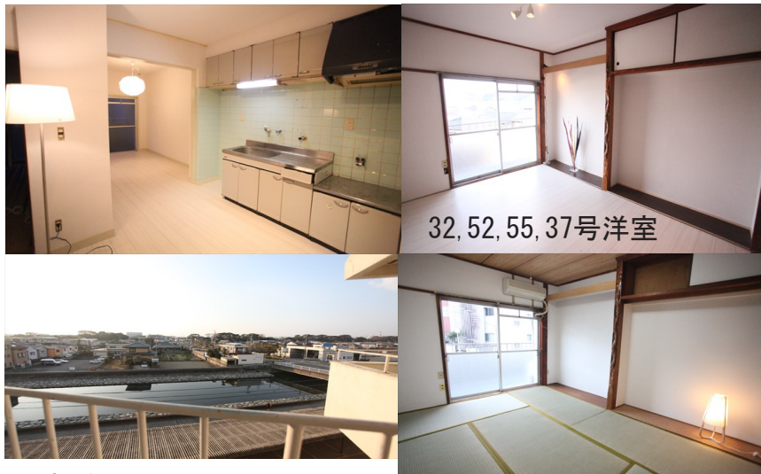
32, 52, 55, 37号洋室