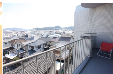
モデルルームは37号室 ご紹介は現地キーBOX